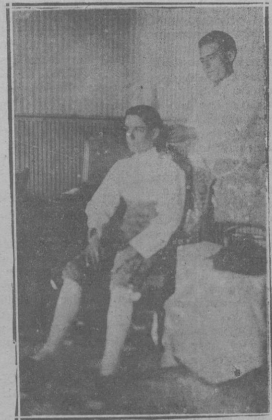
El mozo de estoques, trenzándole la coleta