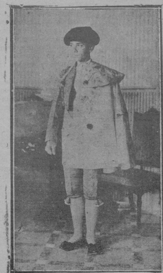
A punto de partir para la plaza; la primera «pose» ante el objetivo del fotógrafo, con el flamante traje de sellera y oro