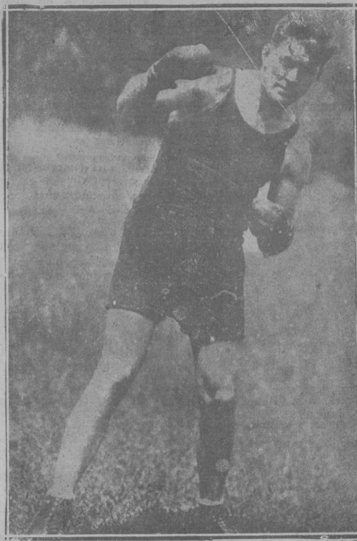
Tunney, el vencedor