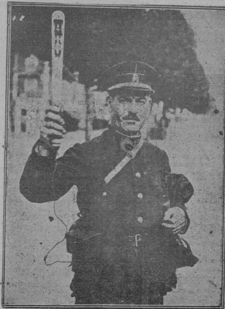
Sirve para regular de noche el tránsito callejero. La porra es de cristal y tiene en su interior unas bombillas. Cada una de un color distinto y según el color significa que se puede o no circular