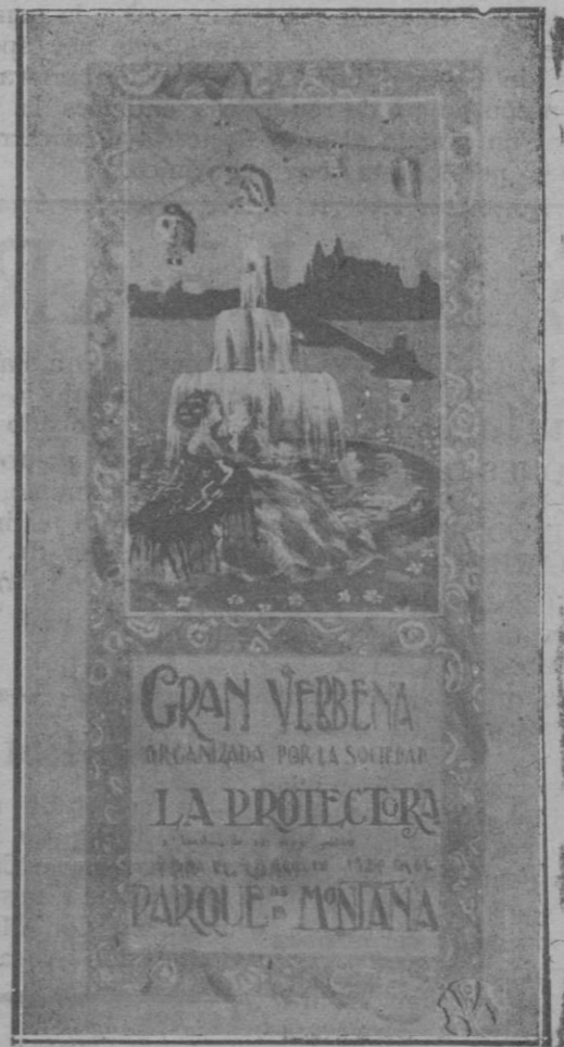
Uno de los artísticos carteles anunciadores de la verbena, original de D. Antonio Quintana Llabrés, socio de «La Protectora»