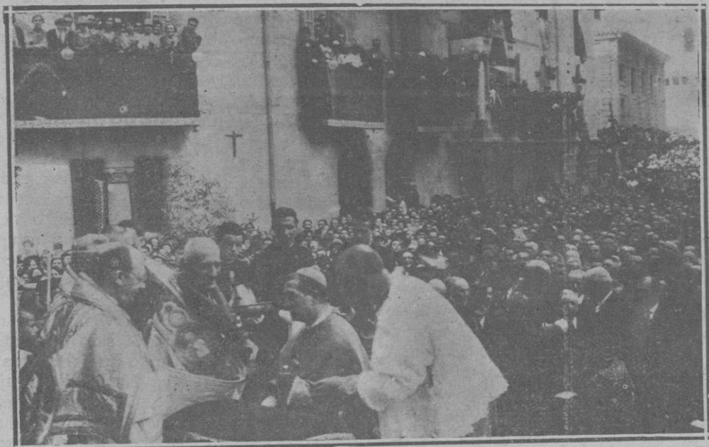
El nuevo Obispo de Vich, besando la Vera-Cruz antes de revestirse de Pontifical para entrar en la Catedral