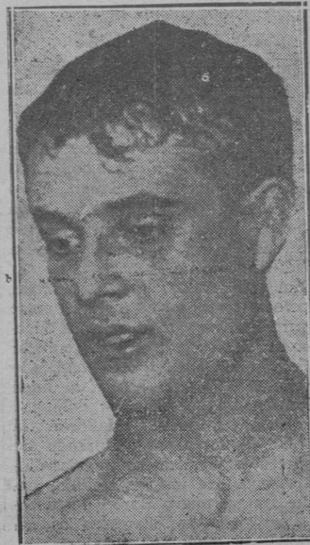
Hilario Martínez, campeón de Europa, que acaba de obtener ruidoso triunfo en América