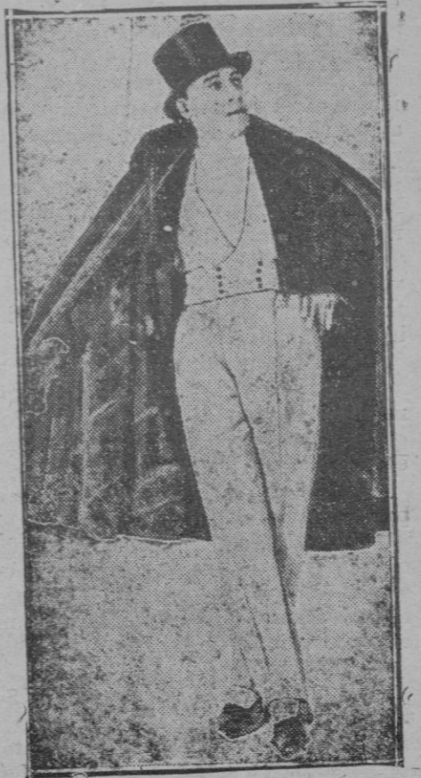
Ultimo modelo del traje masculino de velada, lanzado por un sastre parisién