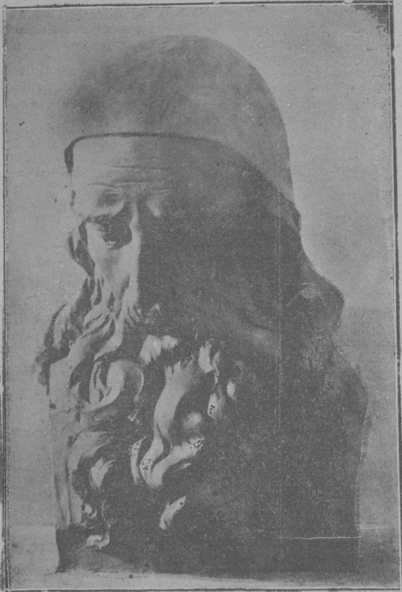
Testa, original del notable escultor Sr. Vila