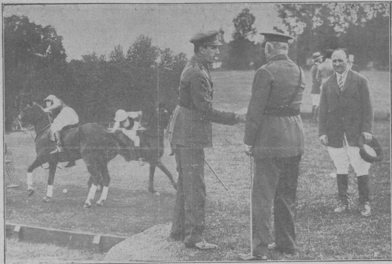
S. M. el Rey en la casa de campo conversando con el Presidente del Consejo al llegar ambos a presenciar el partido