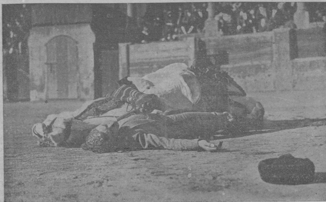
Una de las escenas culminantes de la segunda y última jornada de la película «Carmen» que se proyecta con éxito en el Teatro Principal.