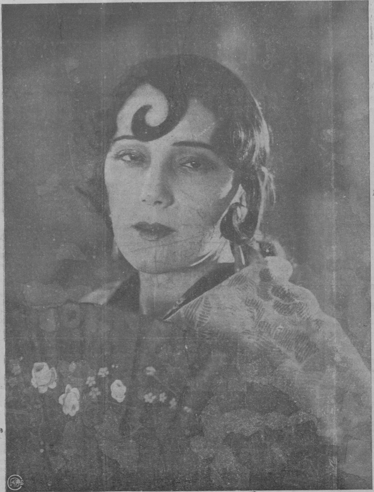
La estrella del cine, Raquel Meller, en la parte de protagonista de la película «Carmen» que ha de estrenarse mañana jueves en el Teatro Principal