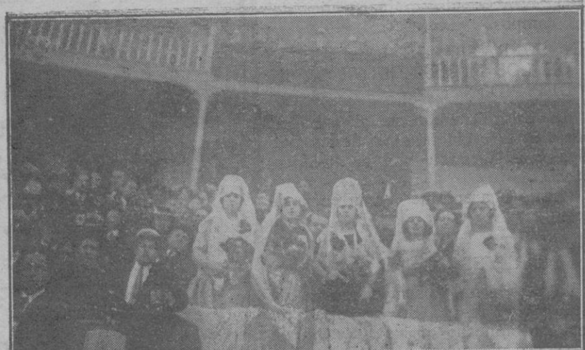
Las señoritas presidentas