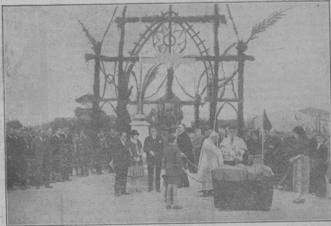
Momento de ser bendecida la primera piedra para las Escuelas a cuya ceremonia asistió el Gobernador Civil señor Llorens

y son trilladas en la era para el alimento del hombre. La vid, con sus sarmientos rebosando vida, extiende sus hojas protegiendo sus racimos, cual si fueran de perlas y amatistas y en el lagar se convierten en exquisito vino que alegra el corazón del hombre y le fortalece para la vida agitada de sus deberes. De entre estas mismas espigas y racimos, Jesucristo los escoge pa-