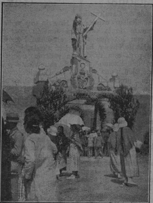
Los peregrinos entrando en Cura