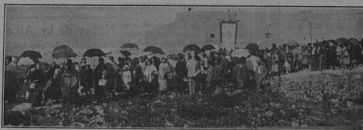
Los peregrinos bajando del Santuario