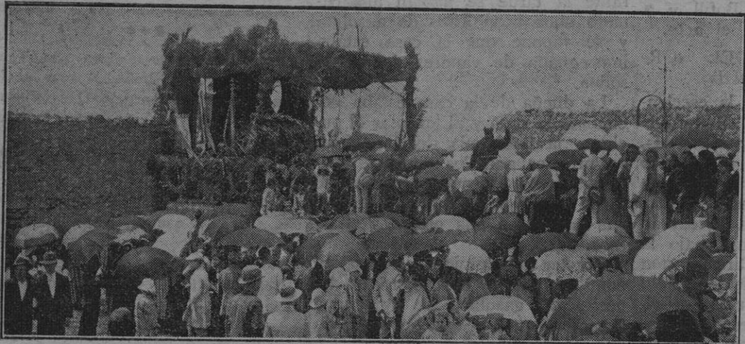
Los peregrinos escuchando a uno de los oradores