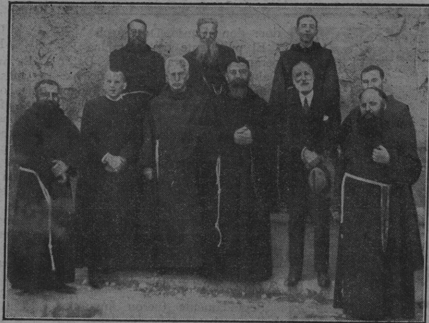
Grupo de oradores que tomaron parte en la fiesta