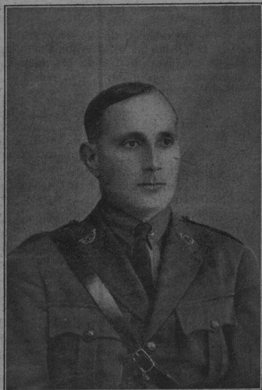
El capitán de Infantería don Antonio Verd y Sastre, muerto por la patria en Casa Aspillera, el 19 del próximo pasado Febrero