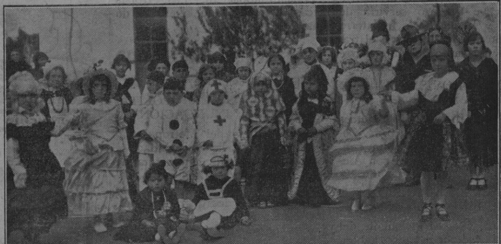
Grupo de niñas que tomaron parte en la fiesta de disfraces celebrada en la mañana del último día de Carnaval