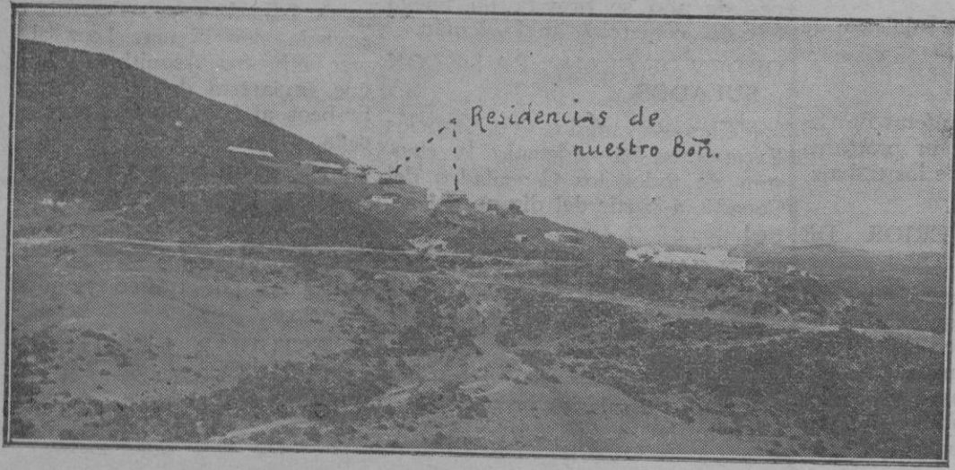
El Fondack, residencia del Batallón expedicionario de Palma