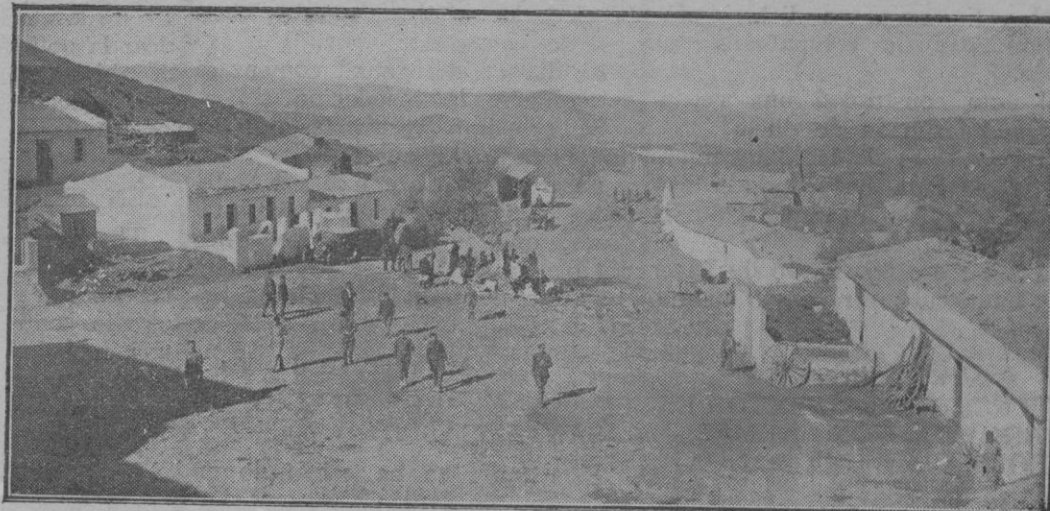
Los pabellones del Fondack, con el automóvil que hace el servicio de Tanger a Tetuán