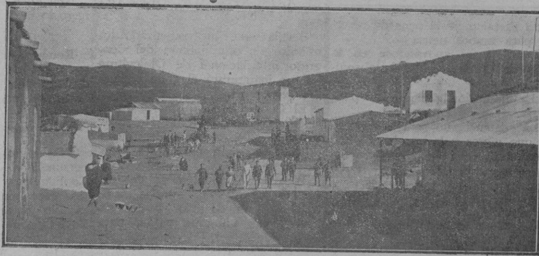
La carretera del Tetuán a Tánger que atraviesa el poblado del Fondack