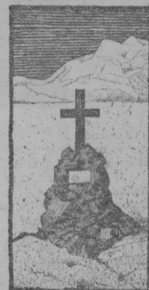
La tumba de Shackleton