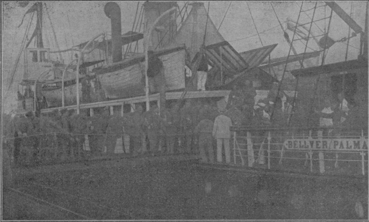
Momento de embarcar la tropa en el vapor «Bellver»