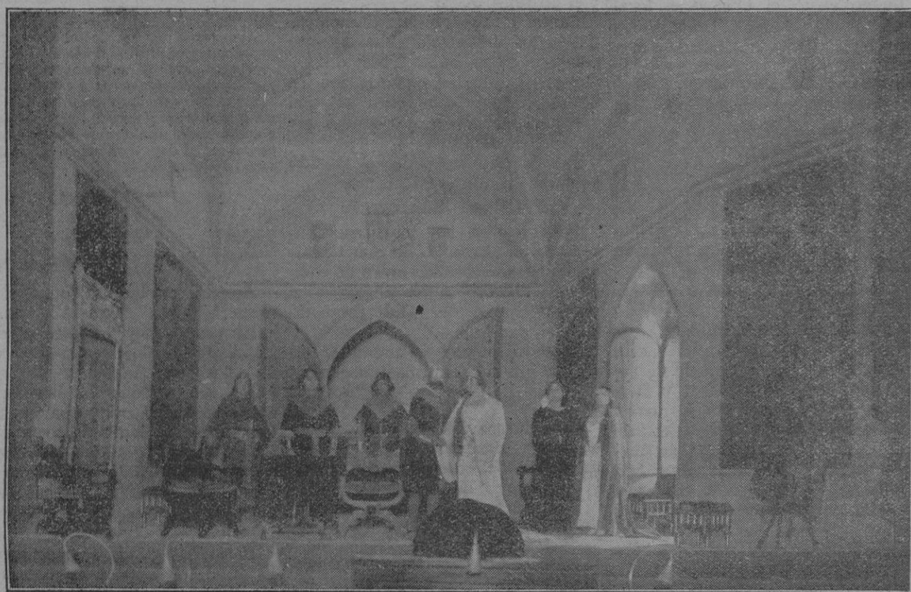
Una escena del drama «Las Aguilas del Rey», estrenada con gran éxito en el Teatro Principal