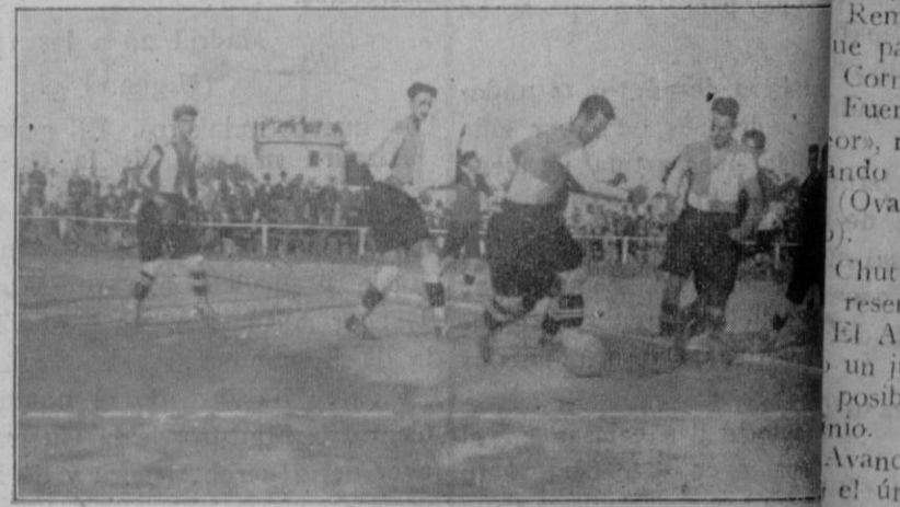
Los de Sabadell defendiendo un ataque de los Alfonso XIII.