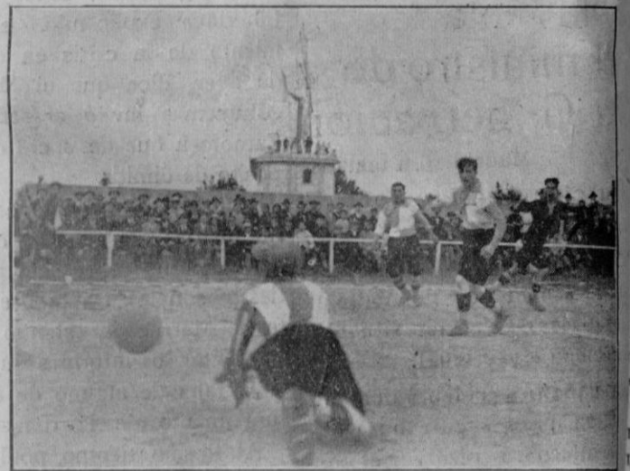
El portero del «Centre Sports» de Sabadell defendiendo un fuerte chut de Nadal, el cual se transformó en gol.