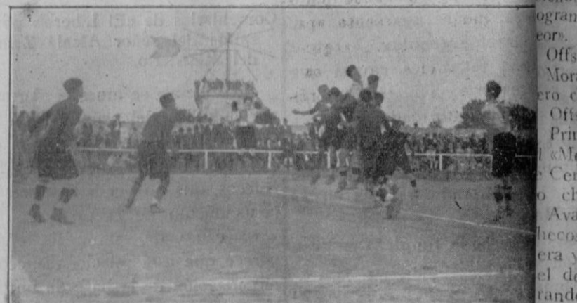
Un momento de peligro, después de un corner.