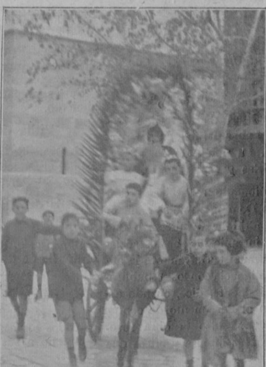
Pintoresca carroza, a'egórica de San Antonio que llamó mucho la atención.