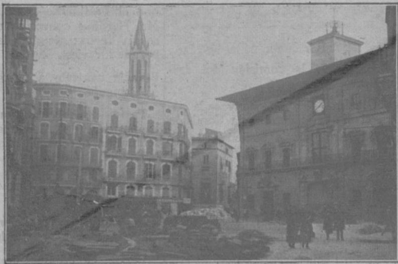
Vista de la plaza de Cort y calle de la Cadena, desde la plaza de Antonio Maura, después de derribada la illeta de Cort.