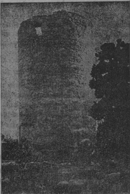
El molino de Villafranca, cuyas aspas causaron la muerte al P. Luis de Villafranca capuchino, de que habla nuestro colaborador en el artículo que publicamos adjunto