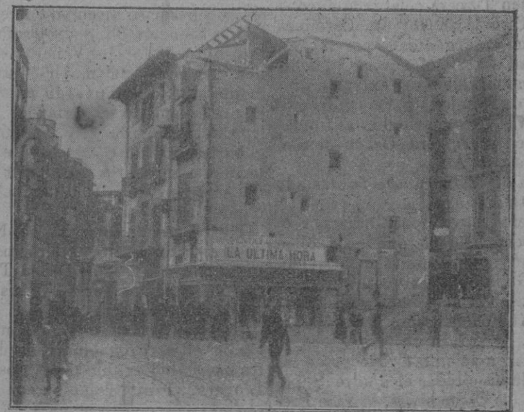
Estado del derribo en la mañana del jueves último. Vista de las obras desde la calle de la Cadena.