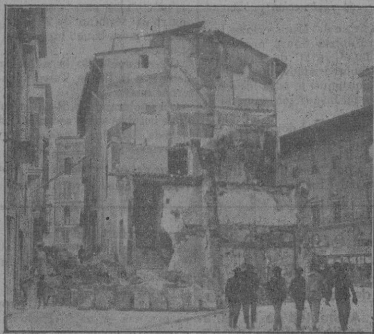
El derribo visto desde la plaza de Antonio Maura