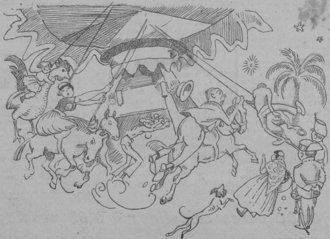
Un detalle de las fiestas: Los caballitos