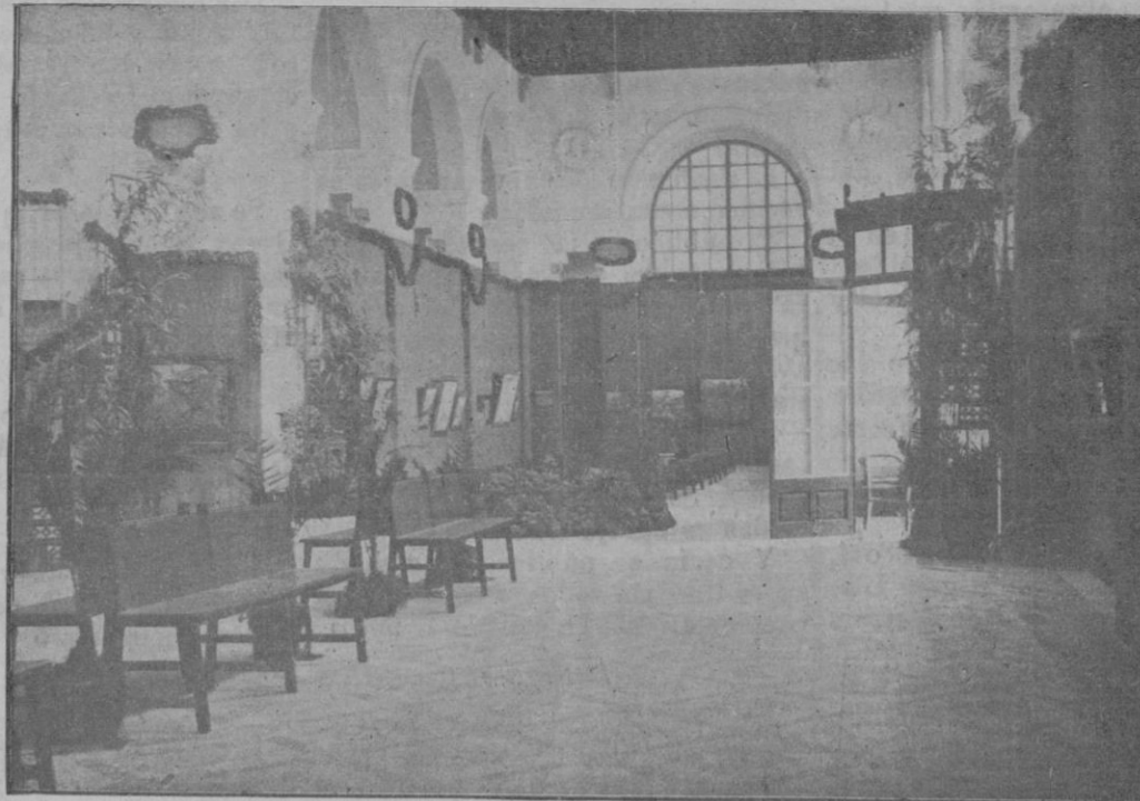
Un aspecto de la Exposición Regional de Arte