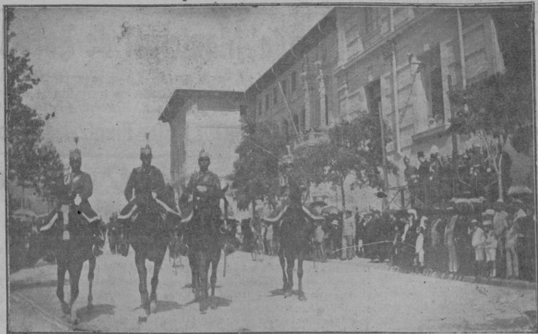
Desfile de las tropas ante la tribuna de las autoridades después de la Misa de Campaña