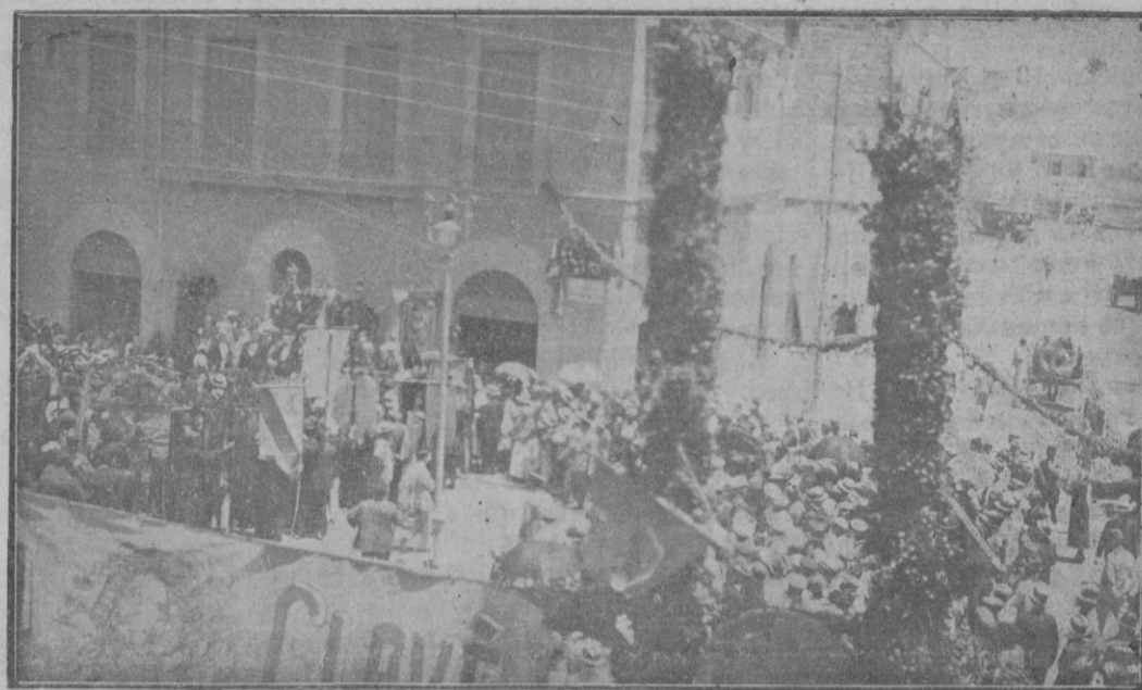
Momento de descubrir la lápida que da el nombre de Clavé a la antigua calle del Matadero