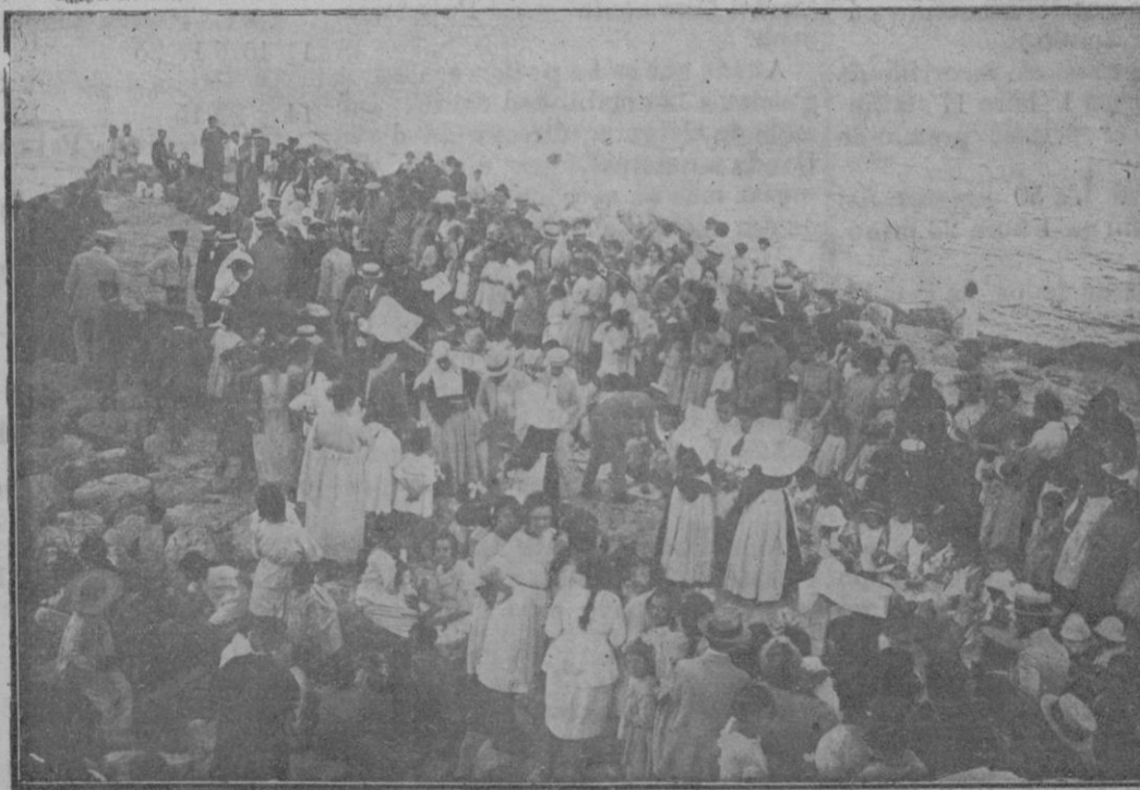
La merienda de los niños de beneficencia