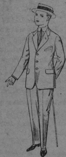
Trajes de lanilla vieja etc para juveniles de 10 á 16 años De ptas. 14 á 48