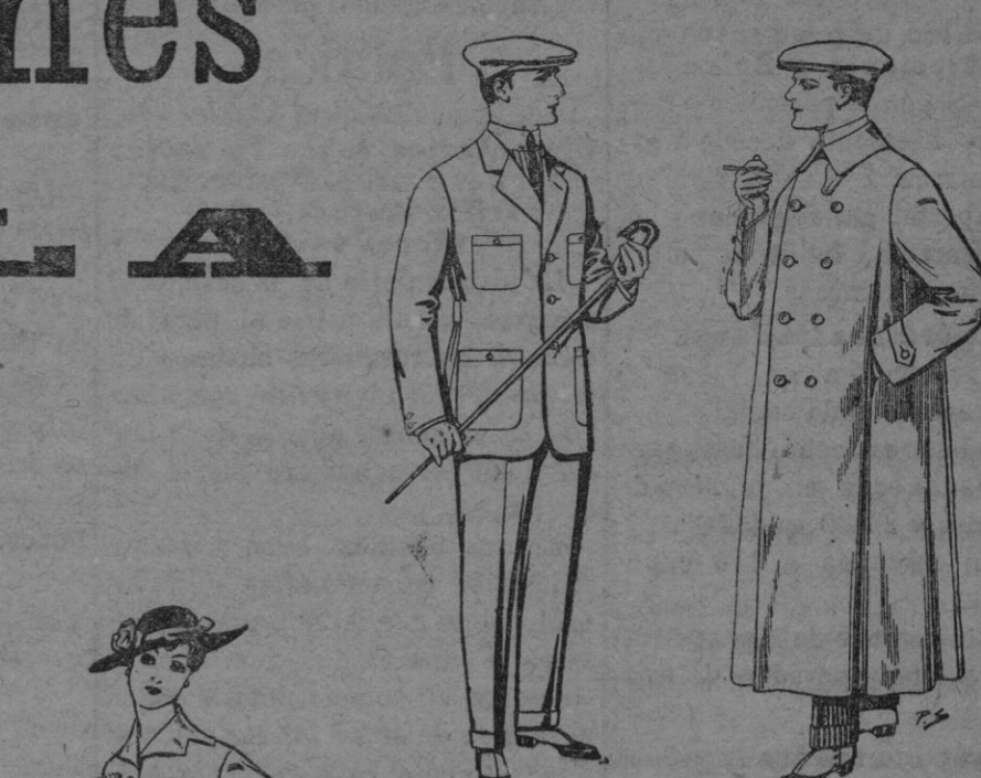
Trajes modelo sport de lanilla cheviot, etc. De ptas. 40 á 47 Guardapo'vos de drill crudo ó gris De ptas. 12'50 á 30