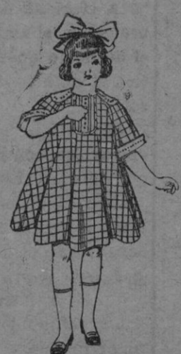
Vestidos de lanilla para niñas de 4 á 9 años De ptas. 15 á 25