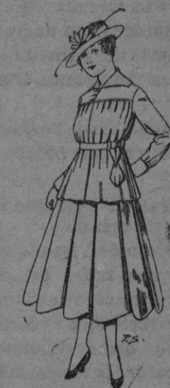
Trajes de lanilla negra azul y color para jovencitas de 13 á 16 años De pts 50 á 55