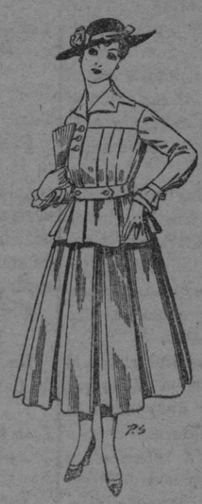
Trajes de lanilla negra azul y color para señora A pesetas 105