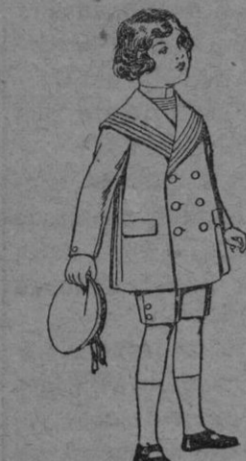
Trajes modelo maletot, de vicuña y zeta, para niños de 4 á 9 años. De pts 12 á 31