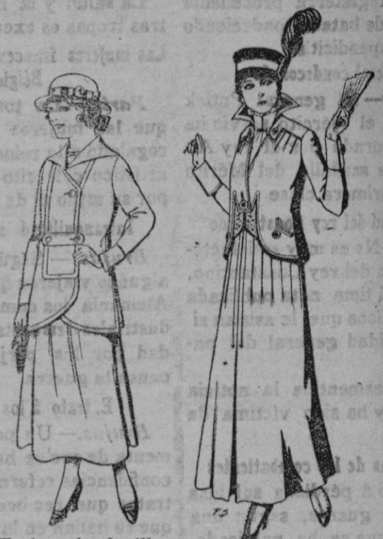
Trajes de lanilla para jovencitas de 13 á 15 años de ptas. 27 á 30. Trajes de lana negra azul y color para Señora Ptas. 55

Madrid * Barcelona * Alicante * Almería * Bilbao * Cádiz * Cartagena * Gijón * Granada * Málaga * Santander * Sevilla * Valencia * Valladolid * Zaragoza