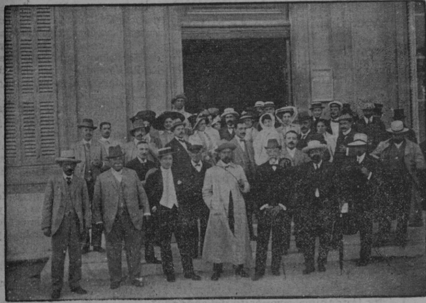
Marsella.—Los excursionistas á la puerta del Museo Borely.