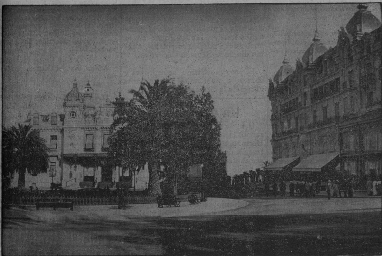
Montecarlo.—El Casino y sus jardines. A uno de los lados varios de nuestros excursionistas.