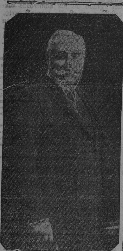
Nuestro ilustre paisano el Exmo. Sr. Don Antonio Maura, el cual recibe actualmente infinitud de muestras de simpatía con motivo del atentado de Barcelona.

A las seis la misma comisión que fué al Consulado español pasó á L'Hotel de Ville donde se recibida por el alcalde interino, pues se estaban