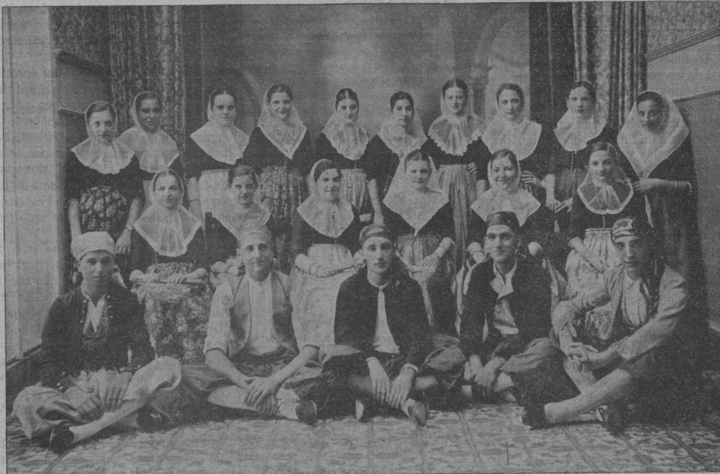
Jóvenes y señoritas que forman parte de la agrupación