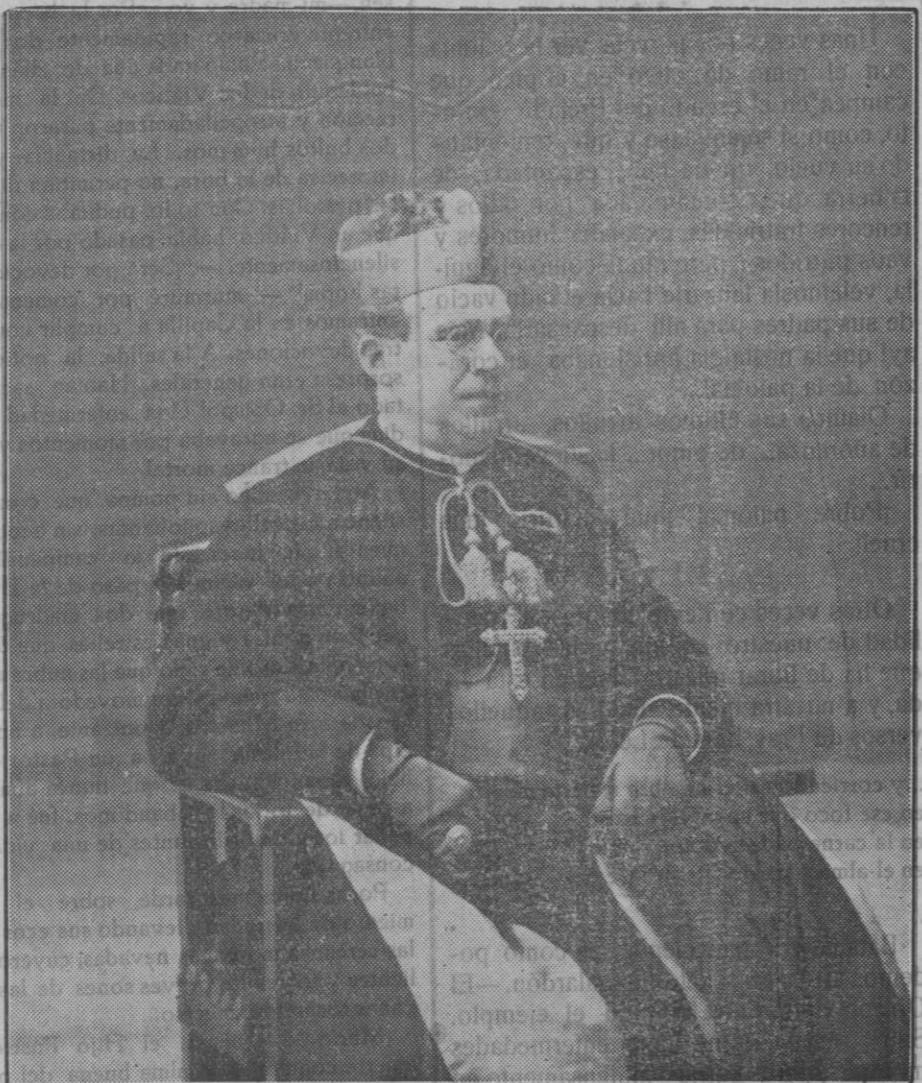
Fray Mateo Colom Canals

La triste noticia se comunicó por teléfono al Excmo. Sr. Arzobispo-Obispo de Mallorca y al Gobernador Eclesiástico de Huesca. En Palma la triste nueva se divulgó rápidamente, y en Huesca, entre sus amados diocesanos, hubo de producir hondo sentimiento. Los telegramas más recibidos de allí lo daban a entender.