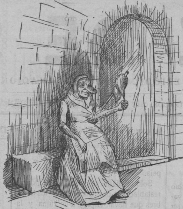
Veuen una doneta veia que filava, amb un llum penjat an es nas

IXÒ era un rei cristià i un senyor moro, amics corals ferm. Un dia s'en anaren a cassar. Quant tornaven, a's vespre, veuen una doneta veia que filava, amb un llum penjat en es nas.