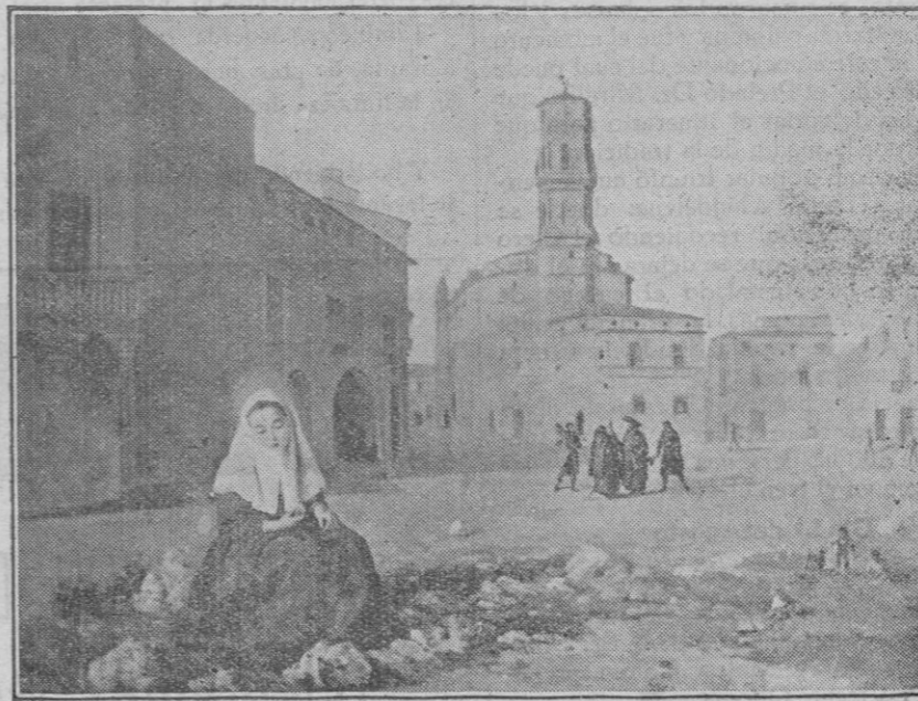
Antiguo grabado reproduciendo la «Beateta» sentada sobre la popular piedra de la plaza del Mercado.

Muchas enseñanzas se desprenden de este pasaje oportunitísimo, como todo el Evangelio lo es siempre; pero además de aplicación muy práctica a los actuales tiempos, en que