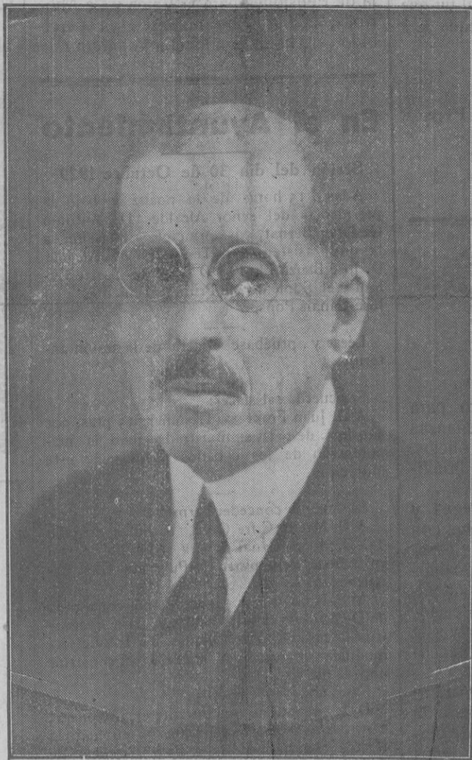
D. FRANCISCO MORAGAS BARRET Director General de la Caja de Pensiones para la Vejez y de Ahorros, cuyo nombre quedará esculpido en letras de oro en los anales de la beneficencia y previsión españolas.

Y de esa Caja de Pensiones, que para muchos, desconocedores del espíritu que la anima, solo representa amontonamiento de millones, que ellos creen improductivos, nacieron multitud de obras buenas, tan buenas, que la misma Iglesia Católica no ha vacilado un momento en ponerlas bajo su sombra benefactora por mediación de las bendiciones de sus Ministros.