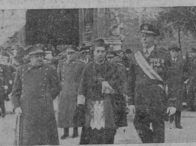
Nuestro amado Prádo saliendo de la Iglesia de San Francisco, en unión del Capitán General y el General Jefe de las fuerzas de aviación.