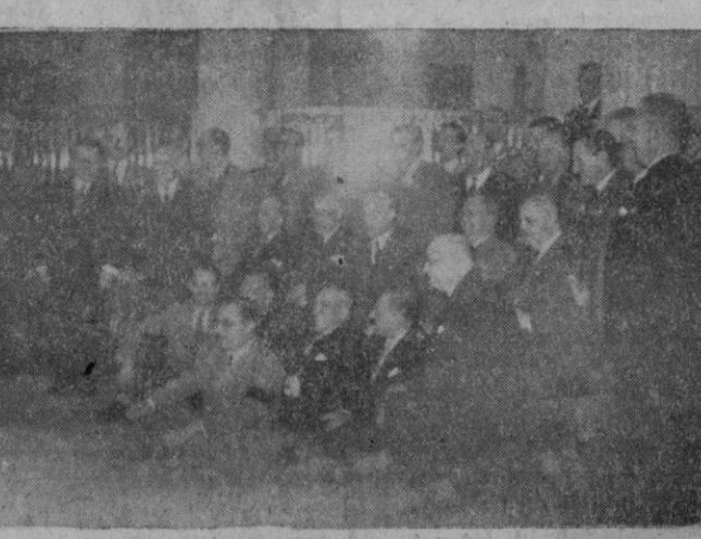
Los asistentes al vino de honor ofrecido anoche por el Subgobernador Sr. Saez de Ibarra en el Banco de España.