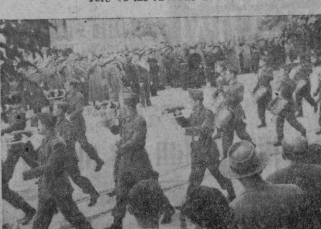
El desfile de las tropas de aviación.