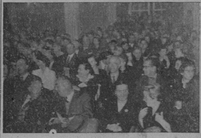
Aspecto del Salón de fiestas del Club Náutico, durante uno de los últimos actos VIII celebrados

de Saint Jacques y en el Colegio de Santa Bárbara. Durante su estancia en la capital francesa surgió en Alemania el primer brote de la revolución religiosa y todo París conspiraba contra la virtud y la fe de Francisco. En aquellos tiempos se produce el encuentro de Francisco Javier con San Ignacio de Loyola y San Ignacio se apodera del alma de Javier. Juntos se postran en el altar de Montmartre, envueltos en una misma bandera. Poco tiempo después comienza su odisea cristiana, casi inverosímil; empieza por Malaca, las Molucas, la Isla del Moro y Japón. Se refiere luego a la muerte de San Francisco Javier en la isla de Bencian, y tras afirmar que San Francisco Javier no puede morir, termina (Pasa a 2.ª pág.)