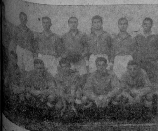
El equipo juvenil del "Mallorca"