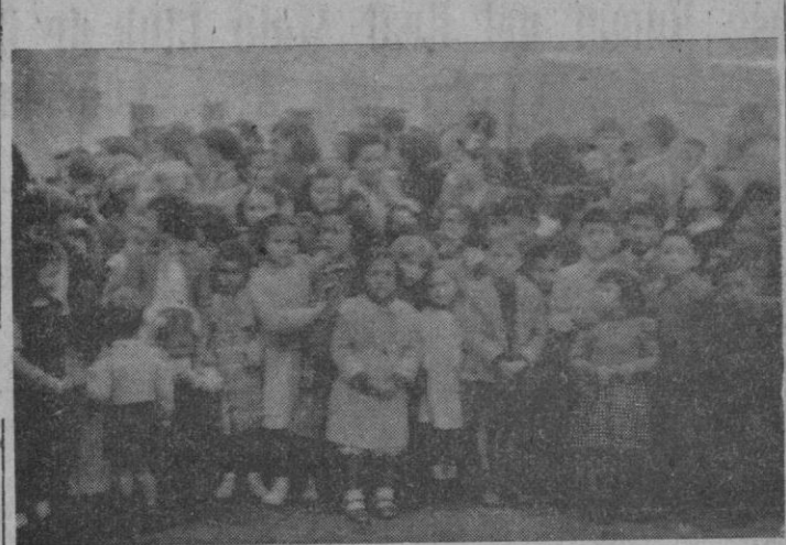
Varios aspectos de la fiesta del árbol celebrada ayer