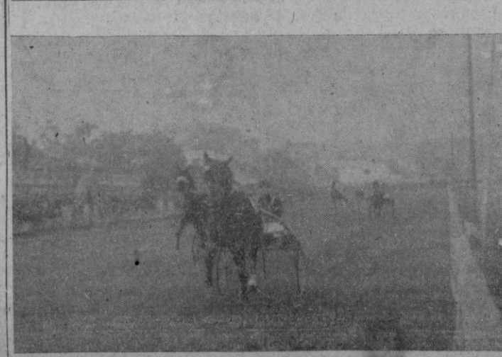
Dos momentos ayer tarde en la Hipica