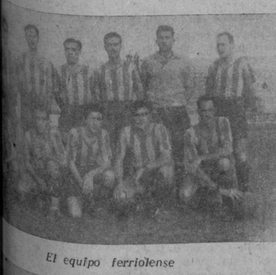
El equipo ferriolense