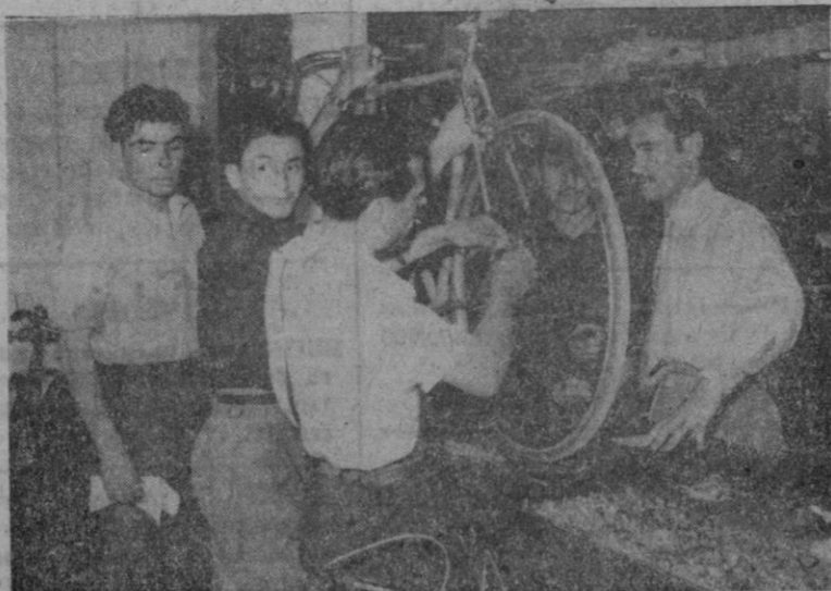
Dos aspectos del momento del recinto de las máquinas para la carrera del desmontable celebrada esta mañana