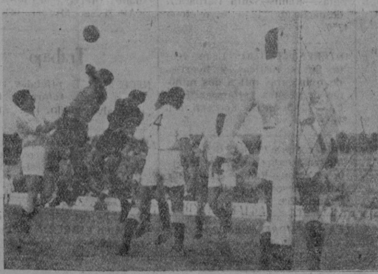
Dos momentos del partido jugado ayer tarde en "Es Forti".