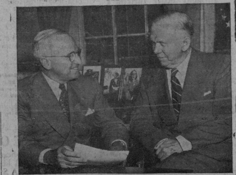
EL PRESIDENTE Y SU CONSEJERO EL GENERAL MARSHALL, TRAS HABER CONFERENCIADO CON EL GENERAL RIDGWAY, COMANDANTE EN JEFE DE LAS FUERZAS DE LAS NACIONES UNIDAS QUE LUCHAN EN COREA GENERAL VAN FLEET, COMANDANTE DEL OCTAVO EJERCITO AMERICANO EN COREA Y JEFES DE LAS RESTANTES UNIDADES QUE CONSTITUYEN AQUEL EJERCITO, EN LA FORMA AL PRESIDENTE DE LAS ÚLTIMAS NOTICIAS RELATIVAS A LA LUCHA ABIERTA CONTRA EL COMUNISMO