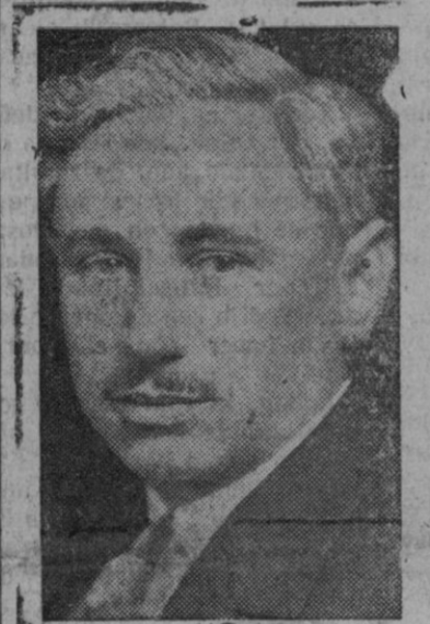
Mr. William Bames Durant, renombrado autor norteamericano.