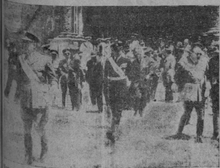
Nuestras Autoridades a la salida de la Misa celebrada en la Basílica de San Francisco.