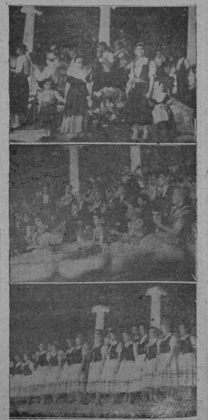
Tres de las Agrupaciones que actuaron ayer en el Coliseo Balear con motivo del Certamen Folklórico.