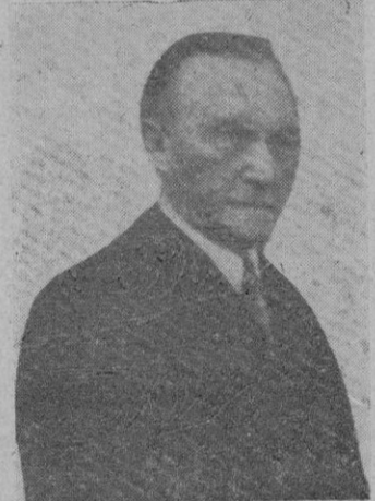
Adenauer, Canciller de Alemania Occidental, quien posiblemente establecerá su gobierno en Berlín.

La mayor significación de este nuevo compromiso, según nos parece, es su relación con los difíciles problemas de alta estrategia que se han estado considerando en el Pentágono, el Departamento de Estado y el Congreso. Muchas cuestiones que eran simplemente teóricas y por lo tanto, podían ser cuidadosamente discutidas, serían suprimidas si en realidad los Estados Unidos envían a Europa algo más que una fuerza simbólica y aceptan la responsabilidad que se derivará del hecho de que sea un jefe norteamericano quien comande los ejércitos de Europa occidental.