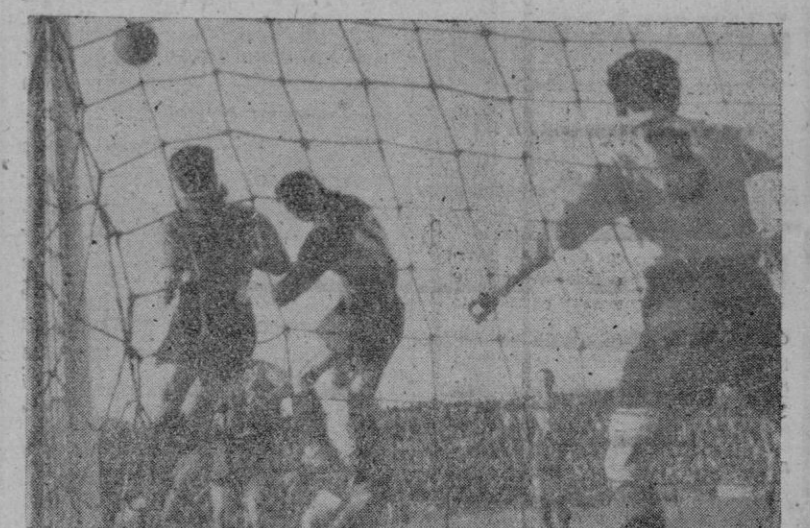
El segundo gol del Mallorca.