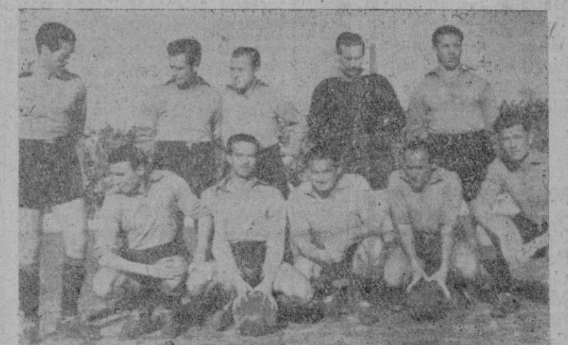
El equipo del Murcia.