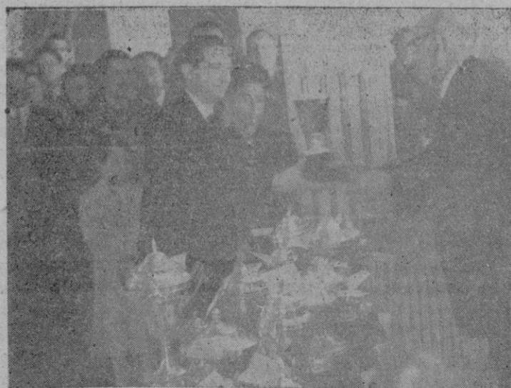
Las autoridades entregan los premios y trofeos a los vencedores en las regatas celebradas durante la temporada de 1949