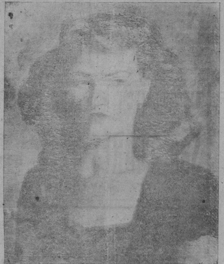
«RETRATO». — Obra del pintor Francisco Miralles

Los funcionarios encargados de administrar dicha suma han manifestado que los