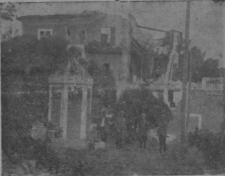
Arriba, la profanada Iglesia de San Carrió; abajo, los destrozados en Porto Cristo, que no hemos de olvidar.

Nunca más oportuno instante que el de ahora para traer a la memoria la imagen de aquel fugaz pasado que el corazón mallorquín supo arrojar lejos de sí. Nunca más a tiempo que ahora para posar de nuevo la mirada sobre estas fotografías que acompañan a esta nota.