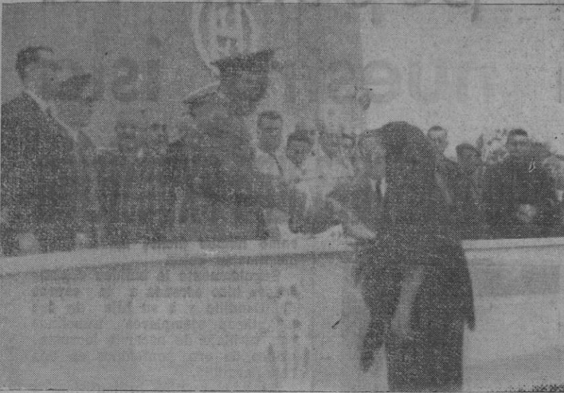
DEL ACTO CELEBRADO EN INCA PARA LA ENTREGA POR EL CAUDILLO DE LAS VIVIENDAS PROTEGIDAS