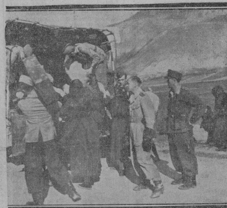
¡LLEVARLOS CON VOSOTROS!!!— Los soldados alemanes ayudan a la población italiana que no quiere quedarse en la parte ocupada por los aliados a la petición: «¡Llévanos con nosotros!, los soldados alemanes corresponden poniendo el camión a su servicio.»

que, para llevarlo a la práctica, sean compiladas todas las actas de las sesiones extraordinarias que celebren los Ayuntamientos de la provincia, con las que se confeccionará un artístico álbum para ofrendarlo al Caudillo.