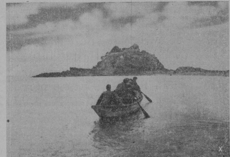
LO PINTORESCO EN LA GUERRA.—Este castillo situado en una pequeña isla próxima a la costa francesa del Atlántico, sirve de alojamiento a las tropas alemanas.

Zagreb.—Un decreto firmado por el Jefe de Estado croata, Ante Pavelich, dispone la nacionalización de toda la propiedad judía e bienes inmuebles, que serán más tarde transferidos eventualmente a propietarios croatas. La dirección estatal de emigración el valor de las indemnizaciones que haya de darse por la expropiación.