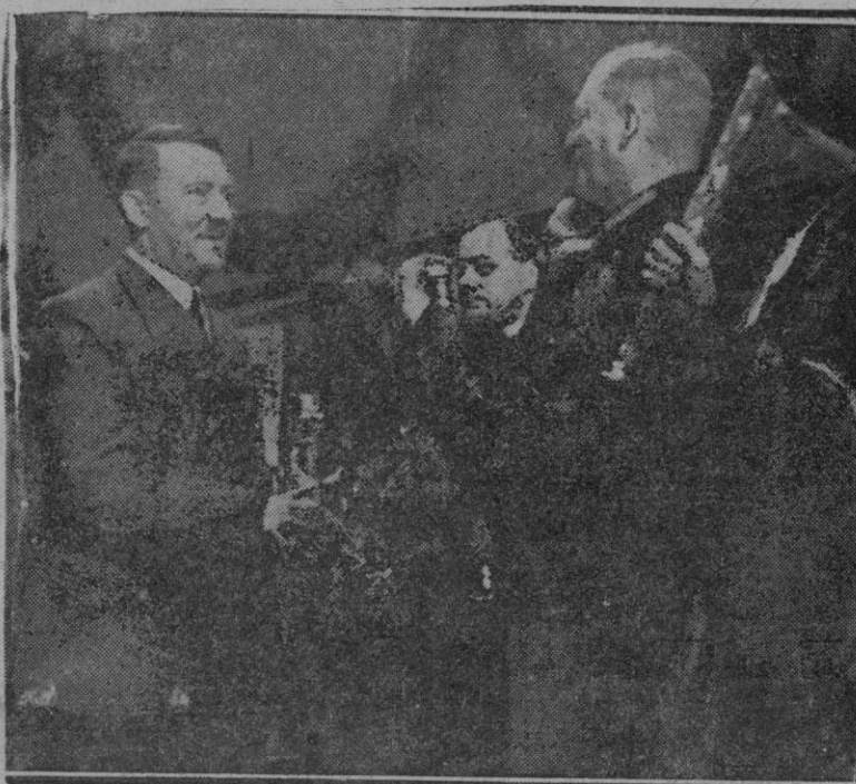
En la foto aparece Hitler saludando a los Mariscales Keitel y Von Brauchitsch, así como a sus ministros Bouhner y Rausenbrach.

Durante todo el día han continuado en la ciudad las colgaduras con lazos de luto, permaneciendo todavía a media asta las banderas en los edificios oficiales.