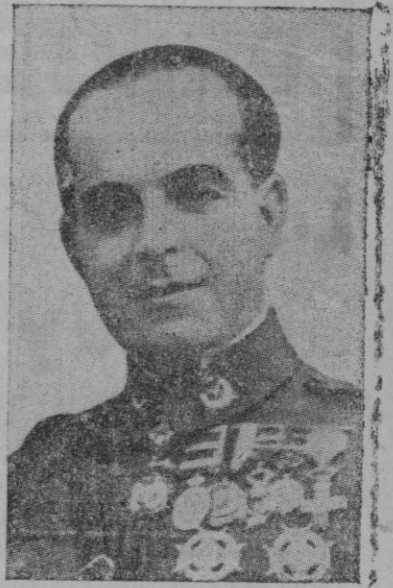
General Excelentísimo Sr. D. José Varela Iglesias, Ministro del Ejército, a quién en el solemne acto de apertura de la Escuela Naval de San Fernando, ha sido impuesta por el Almirante Moreno Fernández que lo es de Marina, la Gran Cruz del Mérito Naval

LA MOVILIZACION TOTAL Helsinki. — La movilización general se ha llevado a cabo en Finlandia con tal rigorismo que han quedado sin profesor más de diez mil alumnos.