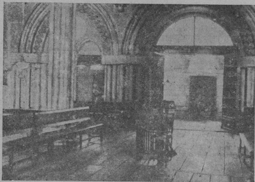
BURGOS.— Vista de la capilla del monasterio de las Huelgas, donde se celebrará la misa que precederá al acto del juramento.

Es, en fin, la consagración de los medios que España ha de tener para cimentar en ellos su poder, su grandeza y su Imperio.