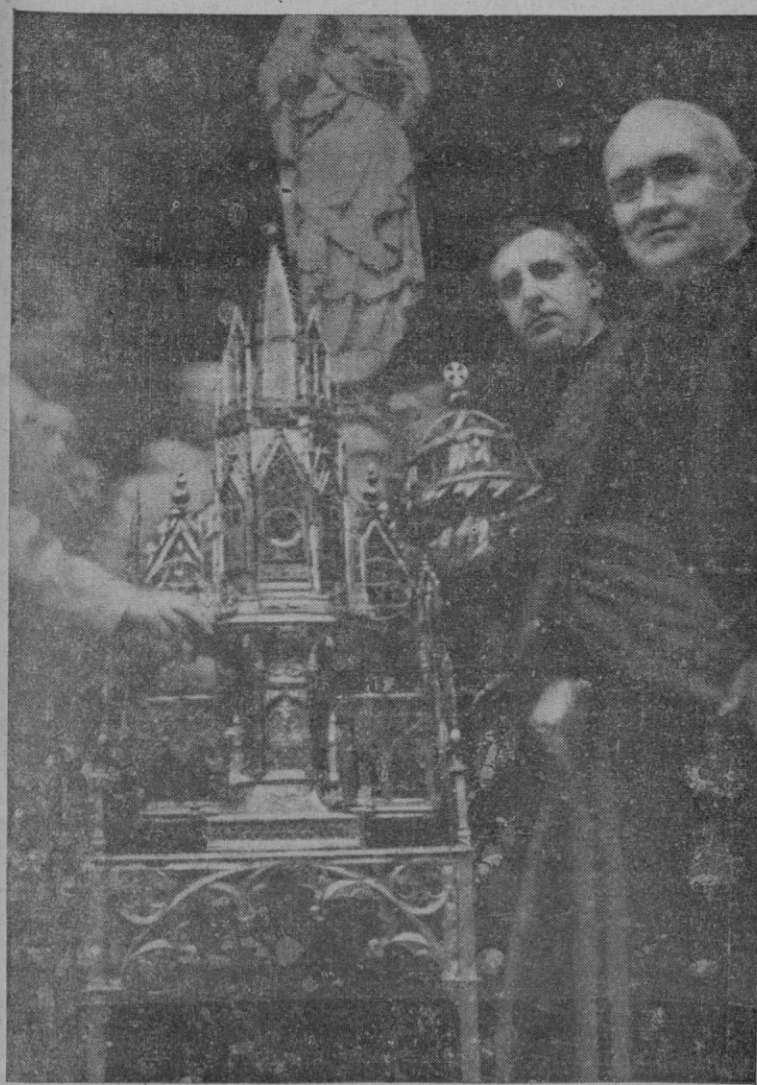
BARCELONA.— La custodia y silla del Rey Martín, que fueron llevadas a Francia, han sido recuperadas por el servicio de Defensa del Patrimonio Artístico Nacional.— Momento de la entrega al Excelentísimo Cabildo de la Catedral.

Varios patronos han ofrecido a sus obreros adquirirles la Medalla del Alzamiento, como recuerdo patriótico y como estímulo para el trabajo y la producción.