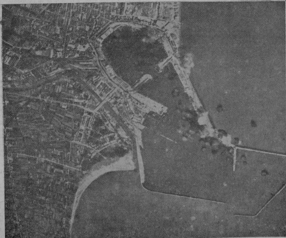
Demostración plena de que nuestros aviones en sus bombardeos persiguen solo objetivos militares.—Véanse en el grabado las explosiones de las bombas en las escolleras del puerto de Valencia