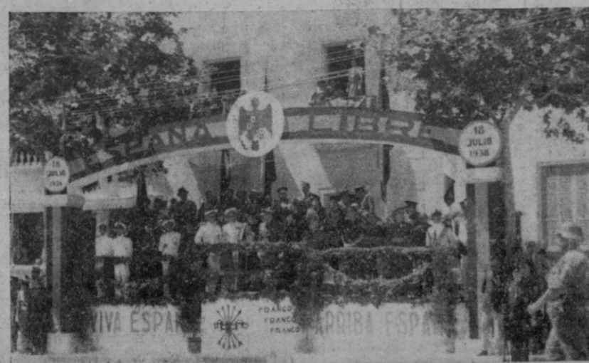
LOS ACTOS DE AYER. — S. E. el Comandante General de Baleares, acompañado de las Autoridades y de las Jerarquías de Falange, presencia desde la tribuna el brillante desfile militar.

Gobierno y Policía. —Da cuenta de la gestión realizada y del material adquirido especialmente para el servicio de incendios; de la organización del Cuerpo de Bomberos que a decir verdad es una cosa admirable. Tal organización, puede decirse que constituye un milagro del Alcalde que ha tenido que reformar y realizar adquisiciones importantes en condiciones difíciles y con presupuestos