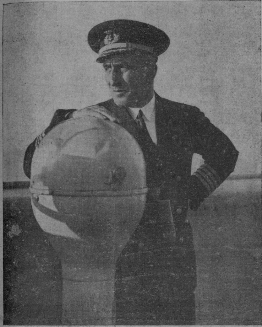
El Jefe de las Fuerzas de Bloqueo del Mediterráneo Excmo. Sr. Don Francisco Moreno Fernández