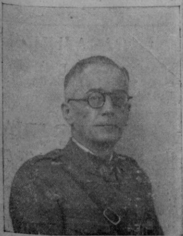
D. Mateo Zaforteza, Alcalde de Palma