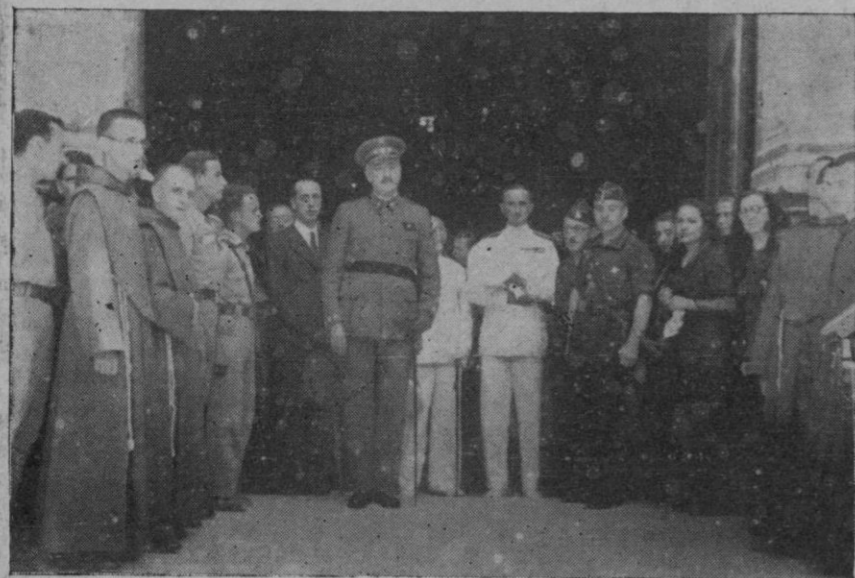
Momento de salir del Templo de San Francisco nuestras primeras Autoridades, después de celebrado los funerales solemnes que, en sufragio de las almas de aviadores heroicos que dieron su vida por España, organizó la Comandancia Militar.